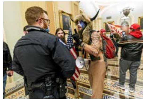
Bilderna från stormningen av kongressen definierar Trump-eran.

Sociala medier-flödet svämmar över av bilder från den fruktansvärda stormningen av kongressen i USA som utropas till årets eller decenniets bild redan nu. Man nickar och håller med,