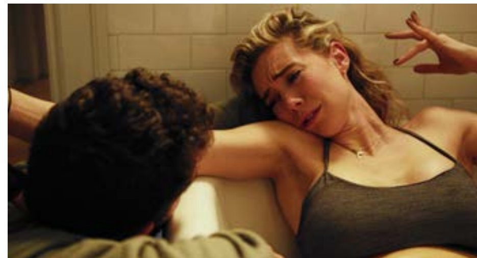
Shia LaBeouf som Sean och Vanessa Kirby som Martha i den starka Netflix-filmen "Pieces of a woman".

Många regissörer tycker om att göra oerhört långa tagningar utan klipp, och ofta känns det mest som självändamål, som ett sätt att visa "titta vad jag kan". Men den över 20 minuter långa tag-